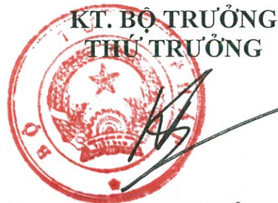
Phan Chí Hiếu

Kinh phí triển khai hoạt động được bảo đảm từ nguồn ngân sách nhà nước phục vụ hoạt động theo dõi tình hình thi hành pháp luật năm 2019 hoặc lồng ghép trong các chương trình, đề án về hòa giải ở cơ sở, phổ biến, giáo dục pháp luật và nguồn huy động hợp pháp khác./.